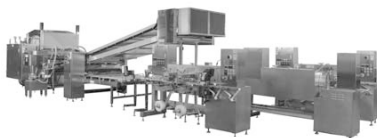
カニカマ製造装置

また、現在、全国中小企業団体中央会の「ものづくり中小企業製品開発等支援補助金（試作開発等支援事業）」において、「木綿豆腐製造自動化装置」の試作機を開発中です。生産ラインの手作業部分の自動化及び木綿布の不使用化を図り、省人化・製品汚染の防止を目指しています。