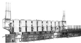
通電加熱式絹豆腐製造装置