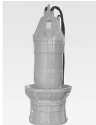
水中タービン発電機

近年、環境問題に対する社会の関心が強まってきており、水力発電所における環境負荷の低減ならびに環境災害の防止についての積極的な提案活動を行っています。具体的には、自動車など様々な分野で電氣化が進展していますが、水力発電所においても、油による油圧制御方式から電氣による電動制御方式、つまり電動サーボモータへの転換を提案しています。また高速回転を支えている軸受けの潤滑油についても、複雑な水冷却方式から空気冷却方式への改修など、設備の簡素化やメンテナンスフリーへの提案を行い採用箇所も拡大しています。