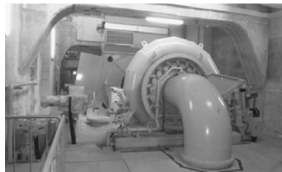
横軸二輪単流両掛フランス水車