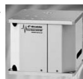
無振動を提供する 「精密除振台」