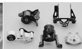
「エンジンマウント」等