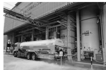
LPG・LNGポンプの運転試験装置

また、一貫生産体制ですので、設計は勿論、現場からも「業務改善提案」を奨励し、品質向上とコストダウンを両立すべく努めております。