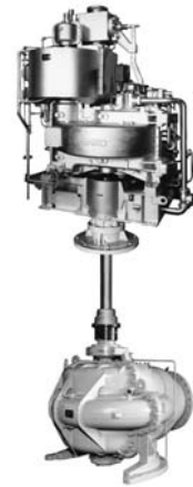
原油タンカー荷役用の ポンプ&タービン

その間、業界のニーズに応えタンカーのカーゴポンプ及びタービン、LPG、LNGポンプ、省エネ発電機タービン、バイオマス発電機タービン等各種新製品を開発してきましたが、これらは全て自社技術をもって取り組んで参りました。今後も一貫生産による信頼性の高い製品を納め、社会に貢献していきます。