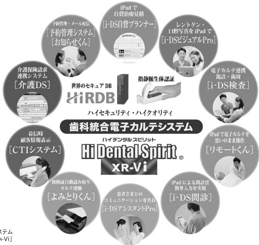
歯科統合電子カルテシステム [Hi Dental Spirit® XR-Vi]

歯科システムに特化したソフトウェアの研究開発を行い、販売・サポートサービスまでを一貫して提供している。日立特約店として(株)日立製作所の最新IT技術を製品に取り込み、信頼性の高いシステムを実現。岡山県をはじめ、大阪から沖縄までの西日本エリアにおける19の拠点を中心に事業を展開している。西日本におよそ25,000件あるといわれる歯科医療機関に2015年10月時点で延べ7,500システムを納入しており、西日本ではトップシェアを誇る。PCとiPadの強固な連携により電子カルテシステムと周辺システムの統合化を実現。他社に先んじた製品競争力及び営業力を有する。