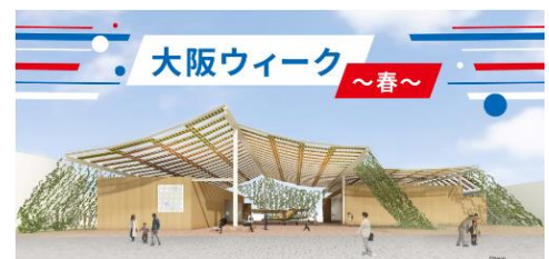
笑おう! 踊ろう! 歌おう! まるごと大阪