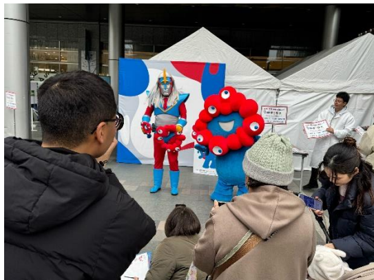
左：万博謎解きゲームの様子 右：万博フォトスポットの様子