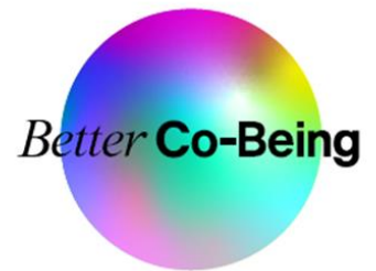
「Better Co-Being」ロゴ(ダイバースフィア)