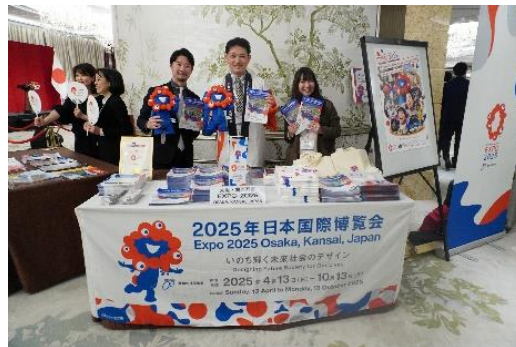
提供: 在香港日本国総領事館(2月20日)