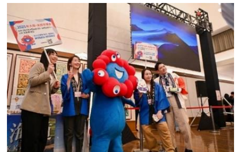
提供: 在中国日本国大使館(2月 25日)