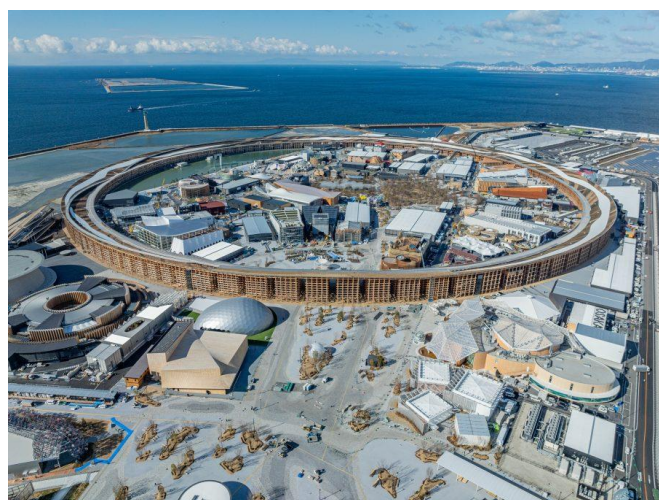
提供：株式会社大林組 撮影：株式会社伸和

【出典】博覧会協会HP： https://www.expo2025.or.jp/news/news-20250228-04/ https://www.expo2025.or.jp/news/news-20250304-02/