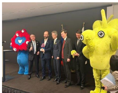
(2 月24日) 左から 長岡駐チェコ日本大使 ラースカ上院議員、ヴィストルチ