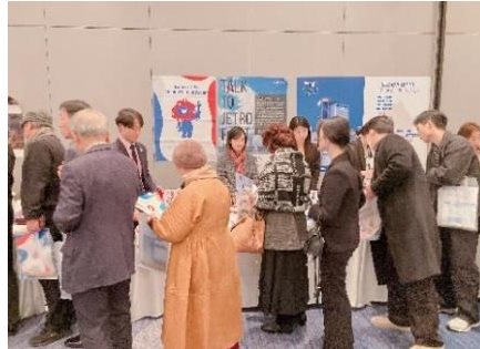
(2月20日) 在釜山日本国総領事館主催レ セプションにおける広報の様子