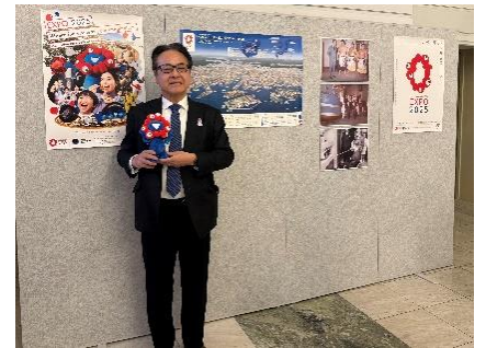
(2月20日) 水越英明駐スウェーデン日本大使