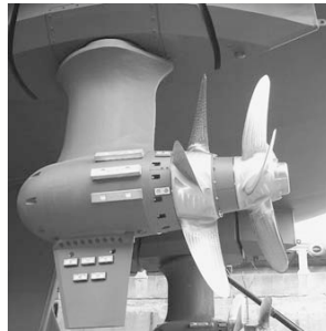
船舶用電気推進装置