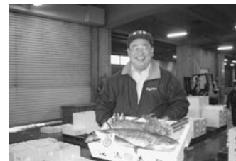
特選産直鮮魚セット

写真は消費地の居酒屋さんへの売れ筋である「特選産直鮮魚セット」で、お陰様で好評を博しています。毎朝、需給を把握し、品質と相場、お客様のご要望を分析、地元や関西圏は勿論のこと首都圏の特定のお客様にも朝獲れ品をその日の夕方までにお届けしています。