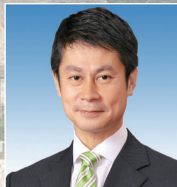
広島県知事 湯崎 英彦