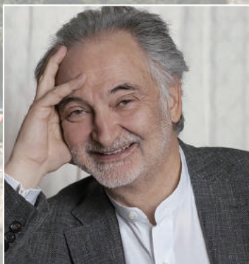
ポジティブ・プラネット会長 ジャック・アタリ