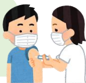
ワクチンの接種状況別新規感染者割合（R3.8.1～31）