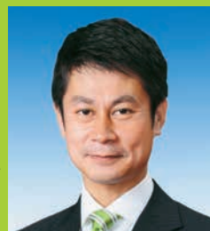
湯崎英彦氏 広島県知事