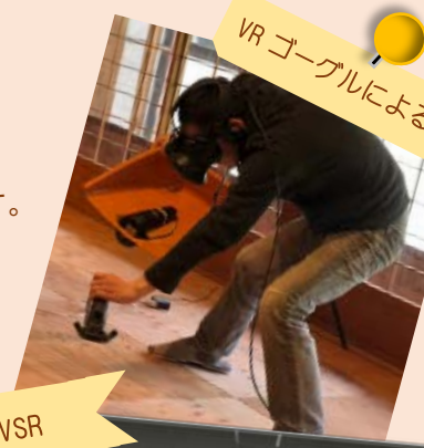
VRゴーグルによる体験