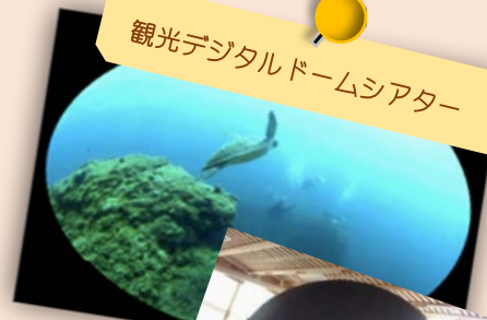
観光デジタルドームシアター